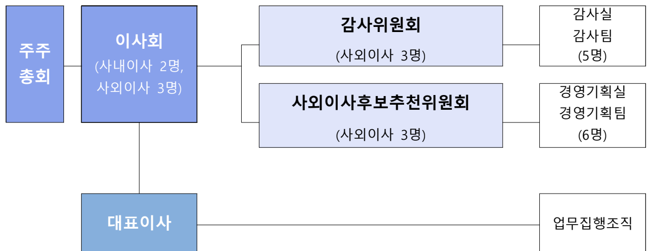
▷ (표 4-①-1) 보고서 제출일 현재 이사회 관련 조직도

당사 이사회 규정상 이사회 의장은 대표이사로 규정되어 있으며, 유고시에는 이사회 규정 제5조 3항 및 정관 제 27조에 따라 직무를 대행할 수 있습니다. 현재 의장은 대표이사로서 직무를 수행하고 있으므로 대표이사와 이사회 의장은 분리하여 운영하고 있지는 않습니다. 또한 사외이사들만의 회의체인 사외이사회나 선임 사외이사를 별도로 선임하고 있지 않습니다.